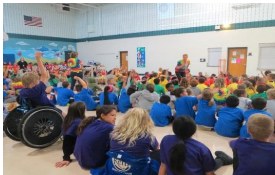
Los estudiantes presentan las banderas del saló en la Asamblea Olímpica el 9 de Oct.